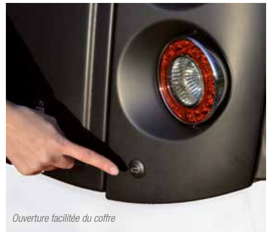
Ouverture facilitée du coffre